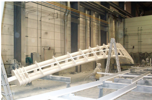
Beschichtung in der Halle