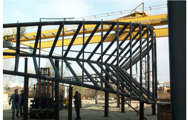
Kompletter Zusammenbau eines Binders mit Schablonen im Werk