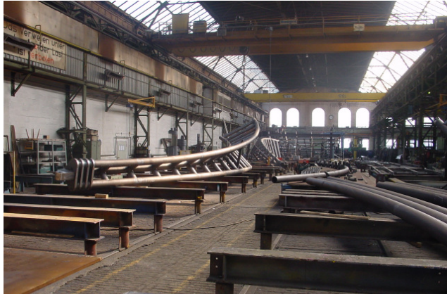
Zusammenbau eines Teilbinders